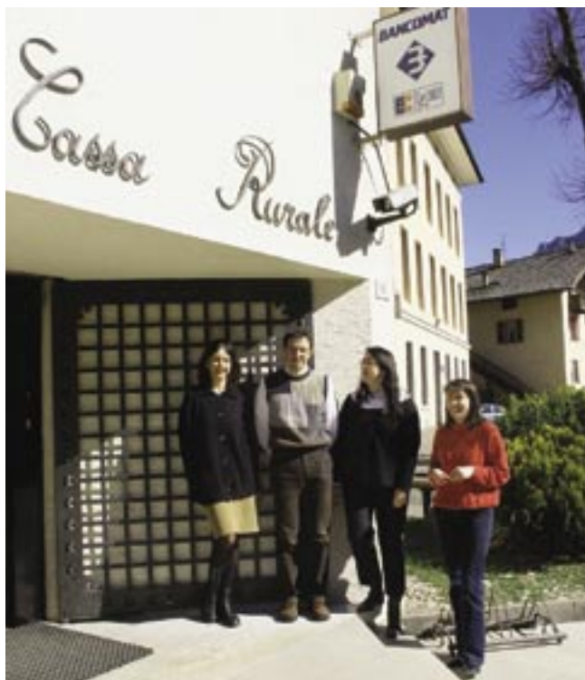
Filiale di Mezzano