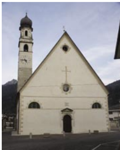
Chiesa di Mezzano

dei nostri consigli. È questo il rapporto che non deve mai venire meno e che stiamo continuando a portare avanti”. L’impressione che si ricava è che il vero impegno di ciascuno, all’interno della filiale di Mezzano, sia quello di mantenere saldo il rapporto di fiducia instaurato con soci e clienti. C’è la consapevolezza che non c’è modo altrettanto ottimale e apprezzato di fare banca.